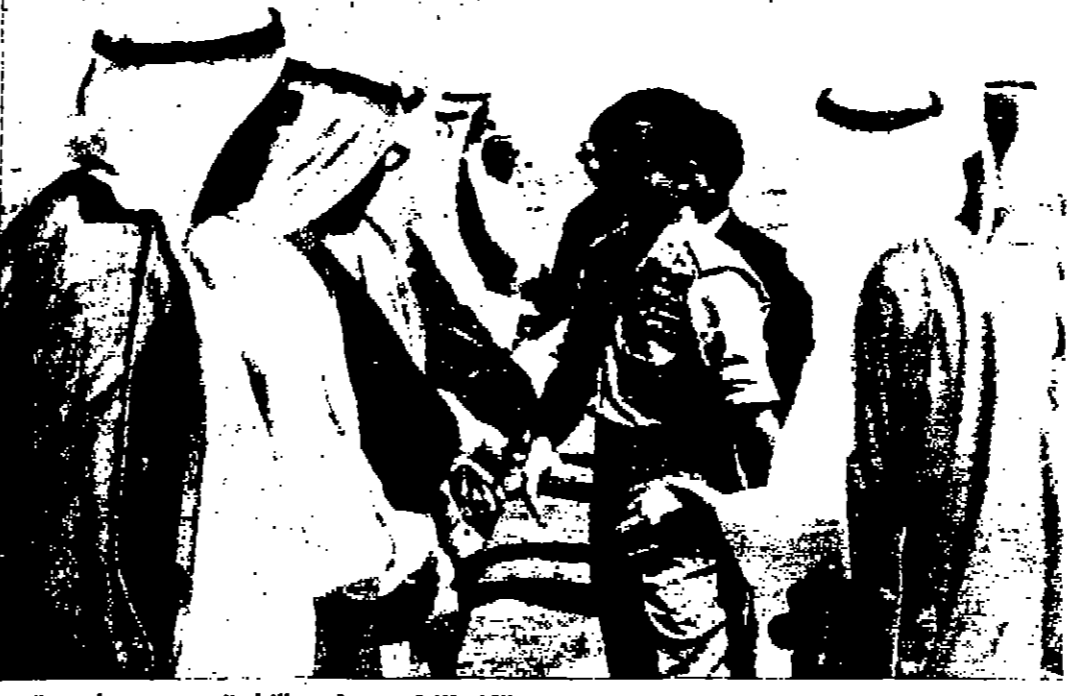
الملك يصاحف رجالات الدولة نسي الكويت خلال زيارته لقطر الشقيق يوم امس الاول